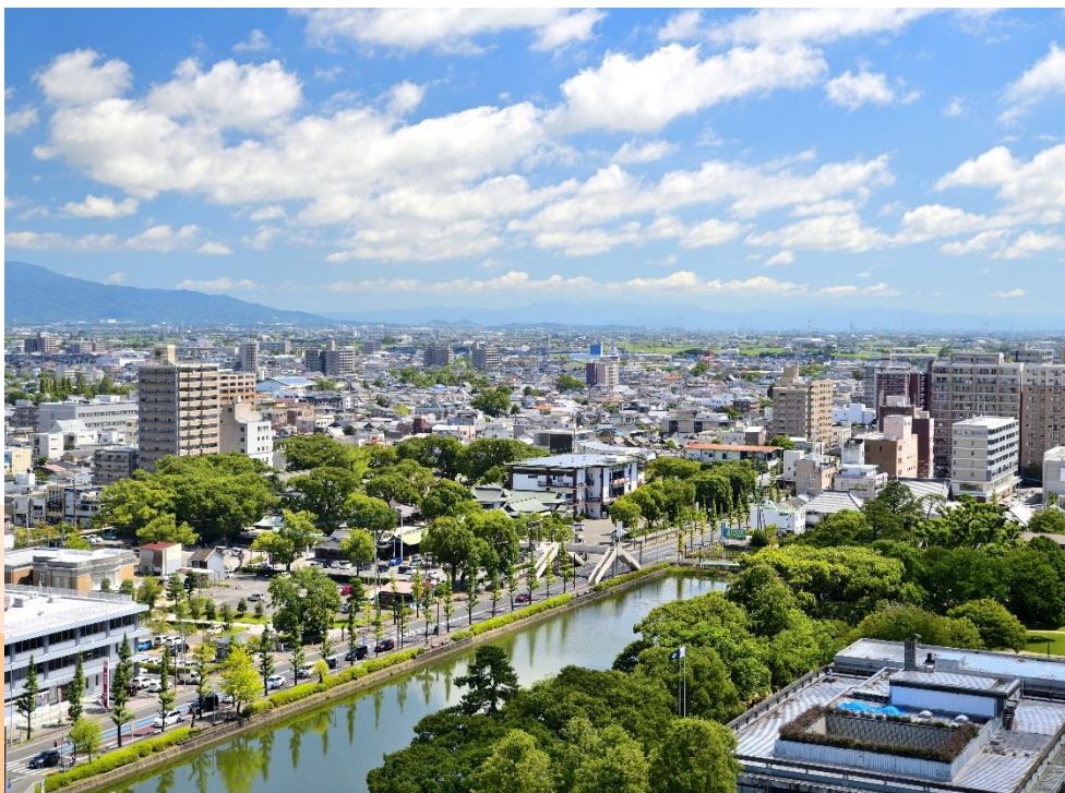
從佐賀縣政廳瞭望的風景（從學校走路3分鐘）

佐賀縣的所在地距離九州的中心福岡市乘坐電車僅需要40分鐘。每年11月份會舉辦國際熱氣球活動，屆時會有世界各地的遊客參加。並且佐賀還有古城遺跡和神社等，是富有日本文化氣息的城市。