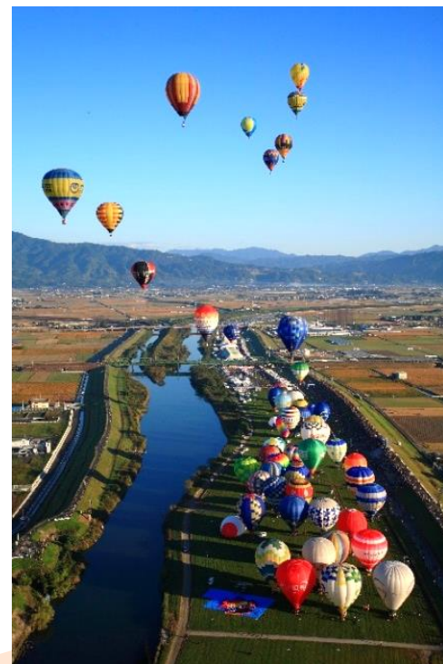
在佐賀縣舉行一年一度的國際熱氣球大賽