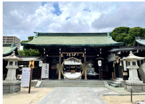
佐嘉神社（從學校走路3分）