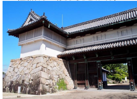
佐賀城遺跡（從學校走路10分）